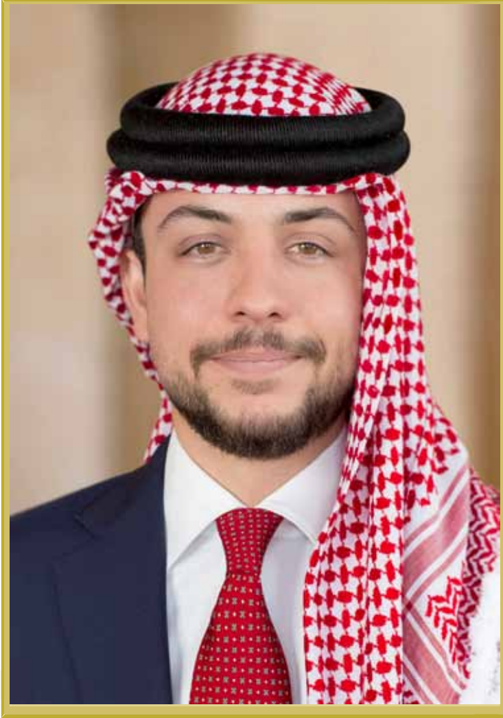
ولي العهد الأمير الحسين ابن عبدالله الثاني