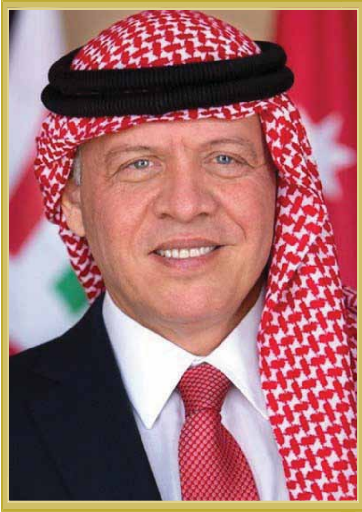
حضرة صاحب الجلالة الملك عبدالله الثاني ابن الحسين المعظم